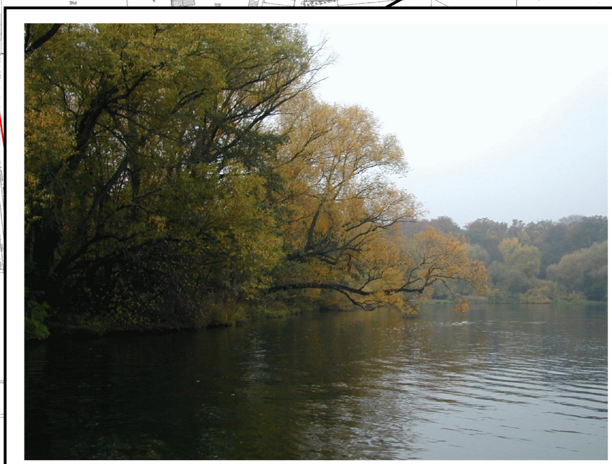
An den Main angebundene Baggerseen

Pufferstreifen mit Gehölz und Extensivgrünland schaffen