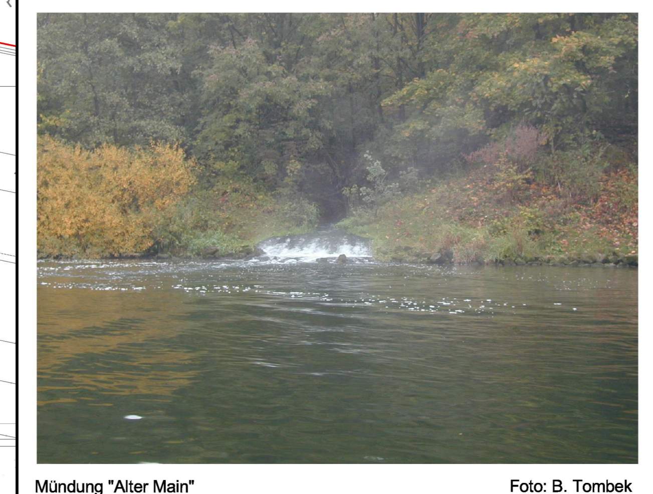
Mündung "Alter Main"