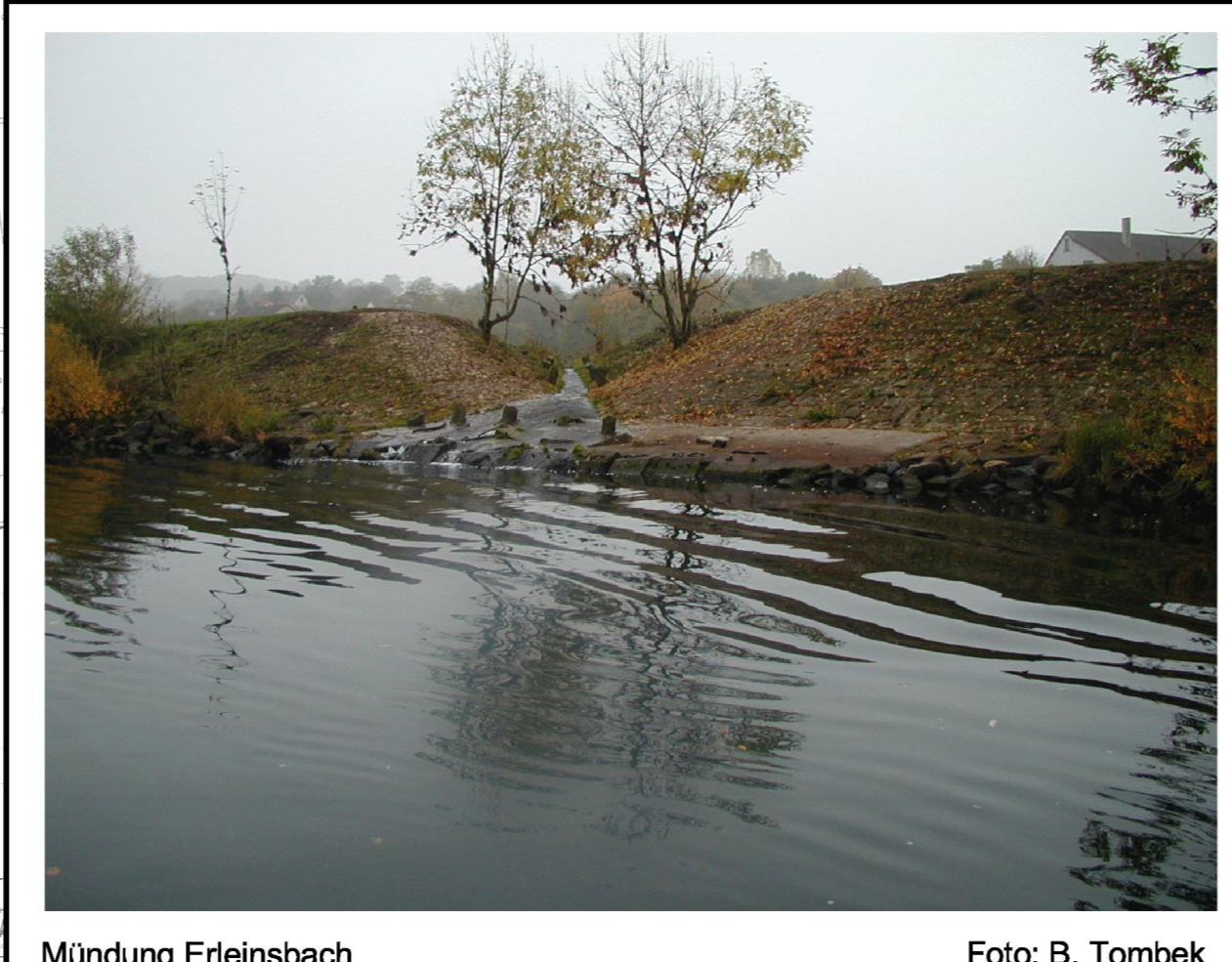
Mündung Erleinsbach

Umgestaltung nach GEP Ottendorf: Durchgängigkeit zum Main wieder herstellen (Umbau der Abstürze unterhalb des "Alten Mains")