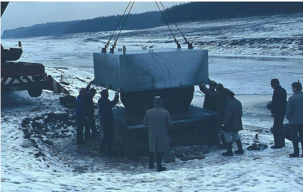
Probeversuch mit der Stahlhaube: Im trockenen Zustand klappte es, die Konstruktion über das Ablassbauwerk zu stülpen.

Der Plan funktioniert auch. Das hatte man im trockengelegten See 1983 und zehn Jahre später sogar nochmal im "Echtbetrieb" unter Wasser getestet. Doch jetzt, wo es tatsächlich Ernst wird, klappt es nicht. Das Wasserwirtschaftsamt hatte vor zwei Jahren Profi-Taucher engagiert, weil man an das Ablassbauwerk ran wollte. "Die haben es mehrfach versucht, aber die Haube einfach nicht festgekriegt", erzählt Rosentritt. Mittlerweile hat sich nun eh herausgestellt, dass die Haubenlösung gar nicht getaugt hätte. Denn wahrscheinlich muss der gesamte Stahlbetonbau unter Wasser saniert werden, weil er von Bakterien befallen ist. Mikrobiell induzierte Korrosion ist die Fachbezeichnung dafür.