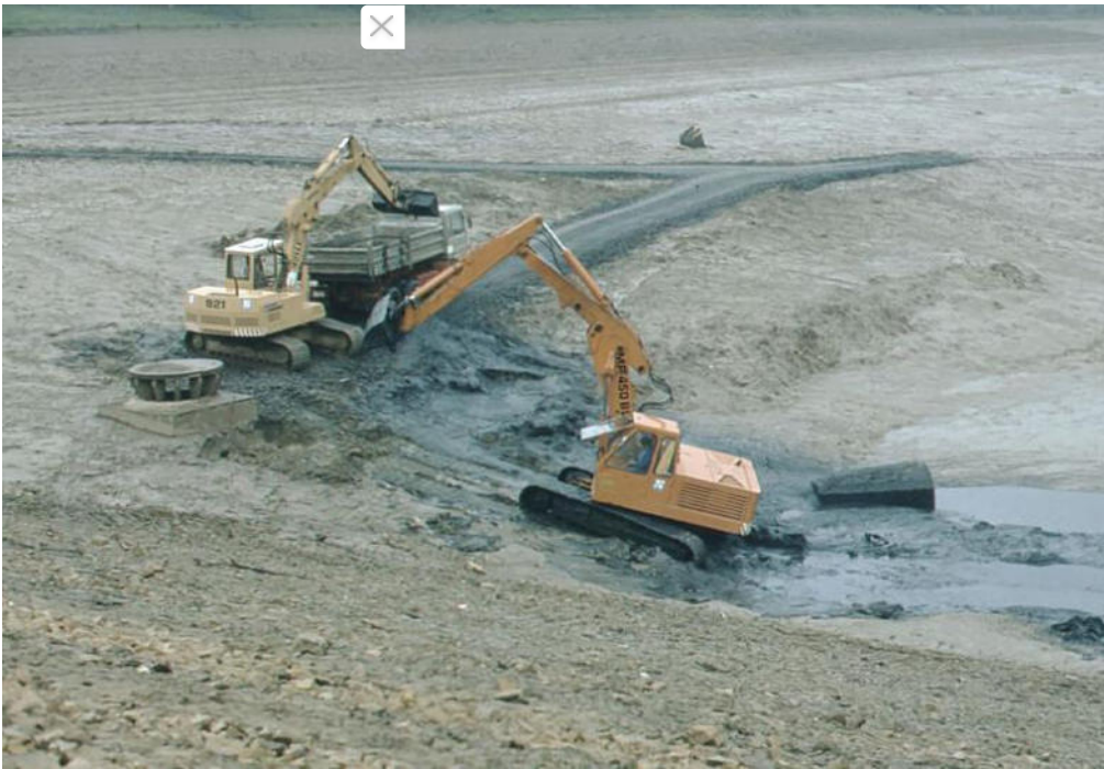
Entschlammung des Hauptsees: Mit Baggern wurde der Schlamm auf Lastwagen geladen und abtransportiert.

Schlange standen später die Bauern mit ihren Fuhrwerken, um sich den "guten Boden" für ihre Äcker zu holen. Heute geht das nicht mehr so einfach. Der Schlamm muss erst auf Schadstoffe untersucht und ein Verwertungskonzept erstellt werden. Rosentritt geht davon aus, dass sich diesmal weniger Schlamm im See befindet. Denn bei der Sanierung 1983 erhielt der Ellertshäuser See eine Ringkanalleitung am Nordufer, über die nun das Abwasser aus der Ortschaft Ebertshausen am See vorbei in den Ablauf geleitet wird.