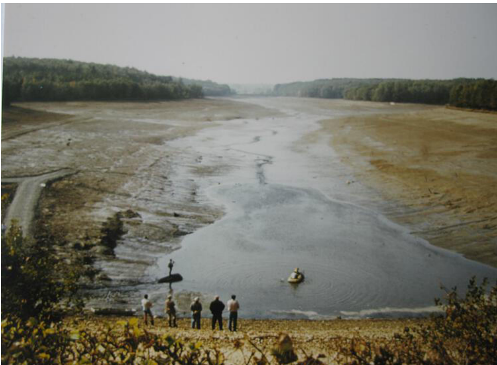
Der Ellertshäuser See ohne Wasser, nach dem Ablassen 1983.