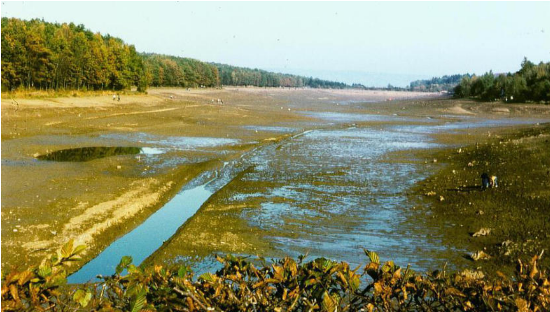
So sah der Ellertshäuser See im Oktober 1983 aus, als das Wasser abgelassen war. 10 000 Kubikmeter Schlamm lagen am Boden, der mit Lastwagen herausgefahren wurde.

Eigenhändig haben sie die Fische aus dem Wasser geholt. Leonhard Rosentritt und Klaus Huppmann waren beim Ablassen des Sees 1983 dabei. Sie erzählen, was sie dabei erlebten.