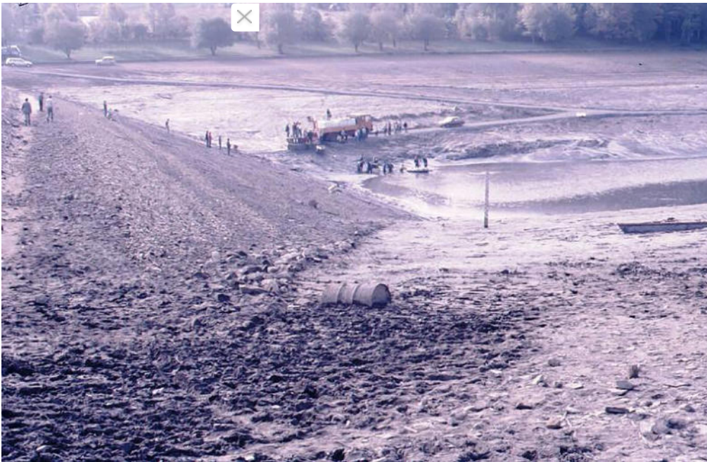
Abfischaktion am Ellertshäuser See 1983. Um die Fische abtransportieren zu können, hatte man 1983 vom Damm aus (links) eine Straße in den See gebaut.