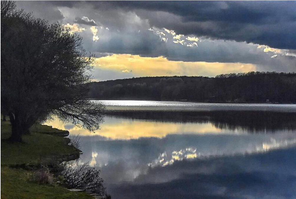
Idyllische Abendstimmung am Ellertshäuser See.

Pflanzenwelt bedeu t , befürchtet Schmidt. Den "gesamtwirtschaftlichen Schaden für den Steuerzahler und die Natur" prognostiziert er auf zig Millionen Euro.